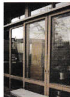
窓の開口部には網戸を！